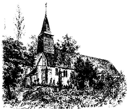
ÉGLISE DE SAINT-MARTIN-AUX-CHARTREAINS