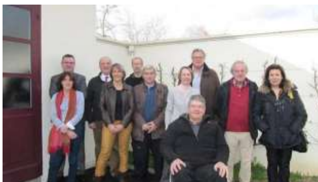
Le conseil municipal