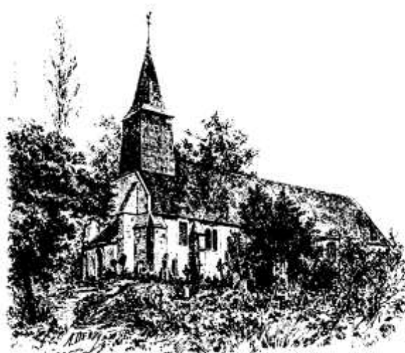
ÉGLISE DE SAINT-MARTIN-AU-X-CHARTRAINS