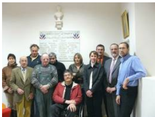
Le conseil municipal